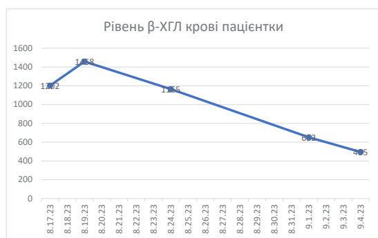
Рис. 1. Рівень \beta -ХГЛ крові пацієнтки

Загальний аналіз крові від 01.09.2023 – еритроцити 3.68 \times 10^{12}/л , гемоглобін – 109 г/л, тромбоцити – 208 \times 10^9/л , лейкоцити – 4.69 \times 10^9/л . 04.09.2023 – рівень \beta -ХГЛ крові – 495 МО/мл.