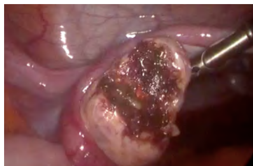
Рис. 4. Плідне яйце видалене шляхом крайової резекції лівого яєчника

Проведено: Утворення повністю видалене шляхом крайової резекції лівого яєчника з використанням ножиць (рис. 4) та відправлено на патогістологічне дослідження. Окрім цього, виконана задня центральна перитонектомія, ексцизія та коагуляція вогнищ ендометріозу. За результатами ПГД у матеріалі виявлені елементи плідного яйця, що підтверджує діагноз ЯВ. Наступного дня пацієнтка виписана в задовільному стані. Через тиждень пацієнтка повторно виконала аналіз крові на \beta -ХГЛ – результат негативний.